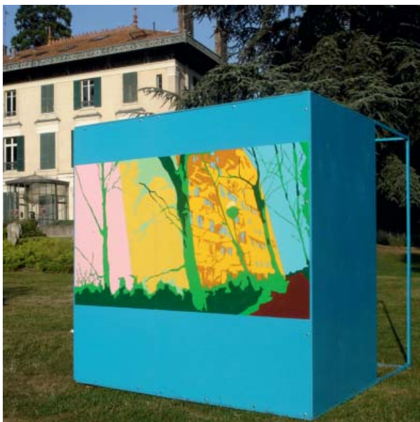
CAMERA OBSCURA OUT OF THE BLUE, 2006 200 × 200 cm Technique mixte