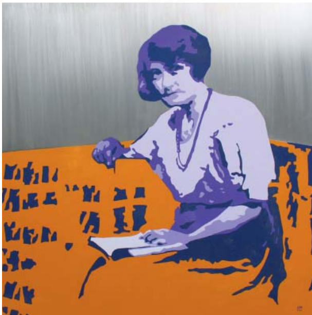
OLIVE, 2013 100 × 100 cm Laque sur aluminium

Tél. 06 63 96 79 28 dale.rowe@wanadoo.fr http://dalejosephrowe.fr