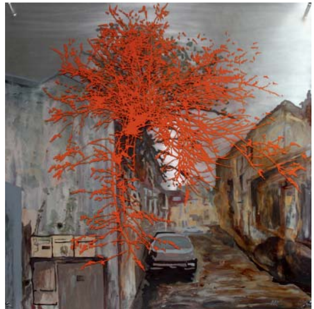
PAPILLION, 2010 50 × 50 cm Laque sur aluminium et plexiglas