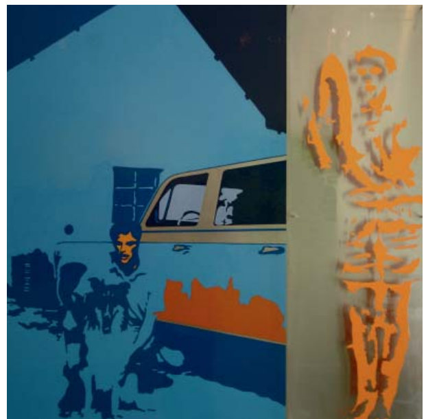
LORD JIM, 2005 100 × 100 cm Laque sur aluminium et plexiglas